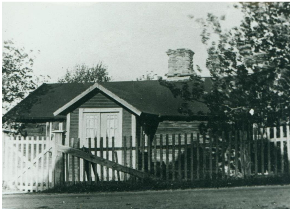
Kistmakare Fagerströms stuga